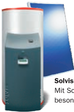
SolvisMax. Mit Solarkollektoren besonders sparsam!

Innerhalb der nächsten 20 Jahre kommen mehr als 100.000 Euro Heizkosten auf Sie zu. Durch eine kluge Entscheidung für intelligente und zukunfts-sichere Heiztechnik können Sie diese Kosten deutlich absenken. Mit dem besten Heizkessel SolvisMax (Stiftung-Warentest 04/2003) und Solarkollektoren sparen Sie bis zu 50 % Heizkosten! Schauen und prüfen Sie selbst: